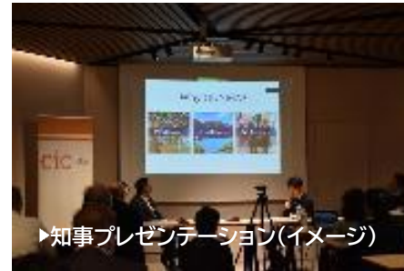
▶知事プレゼンテーション(イメージ)