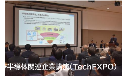
半導体関連企業講演(TechEXPO)