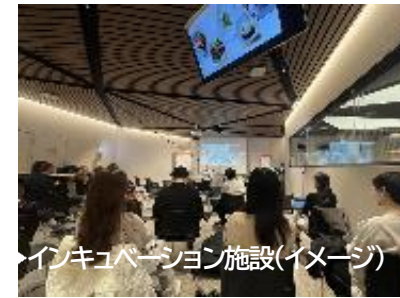
▶インキュベーション施設(イメージ)