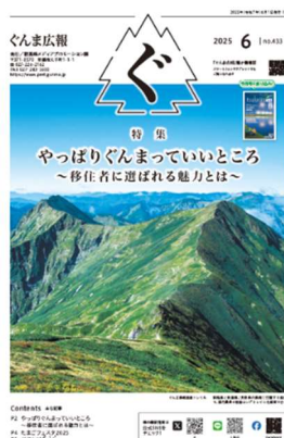
「ぐんま広報」 (2025年6月号)