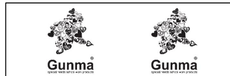
イメージ (実寸大) ※タグを半分に折って製品に縫い込む