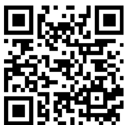
第1回渋川会場 申込期間5/13～6/3