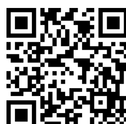
第3回太田会場 申込期間10/5～10/23