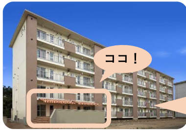
(地域開放スペースの様子)