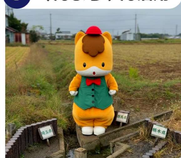
戦略的な情報発信