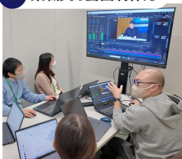
動画制作スキル向上