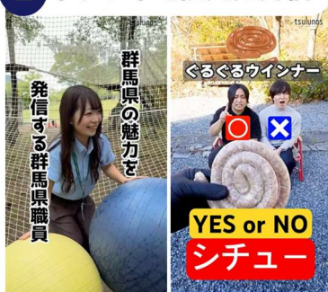
ショート動画活用 (シリーズ・コラボ)