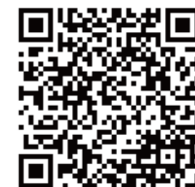
QRコードは(株)デンソーウェブの 登録商標です