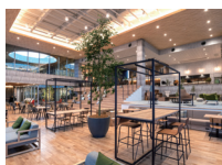
(株) 日東システムテクノロジーズ