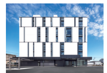
(株) ジーシーシー本社