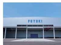
冬木工業(株) 高崎工場