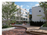
しのめ信用金庫 前橋営業部