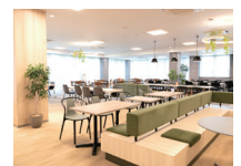
(株) ヨコオ富岡工場