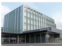
桐生信用金庫 太田スクエア