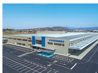
(株) 栗原医療器械店