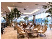
(株) ドンレミー 高崎工場