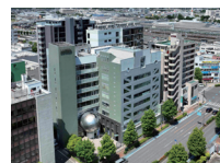
(株) 上毛新聞社 本社