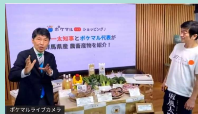
▲山本一太知事と高橋代表によるライブショッピングの様子(令和4年12月10日)

群馬県の登録生産者は173名、令和7年度の取引件数は約15,000件、販売金額は4,100万円にのぼります。