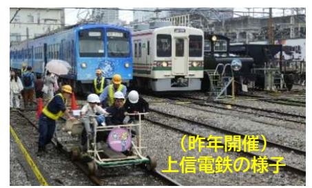
(昨年開催) 上信電鉄の様子

群馬県内の中小私鉄(わ鐵・上毛電鉄・上信電鉄)が毎年交代で開催しているイベントを、今年もわ鐵・大間々駅前で開催します。この日しかできない体験や、グッズなどをたくさん用意して、皆様のご来場をお待ちしています。