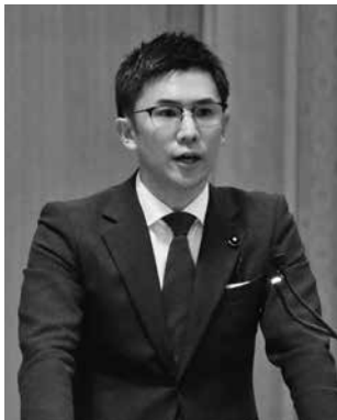
自由民主党 中島 豪 議員（高崎市）