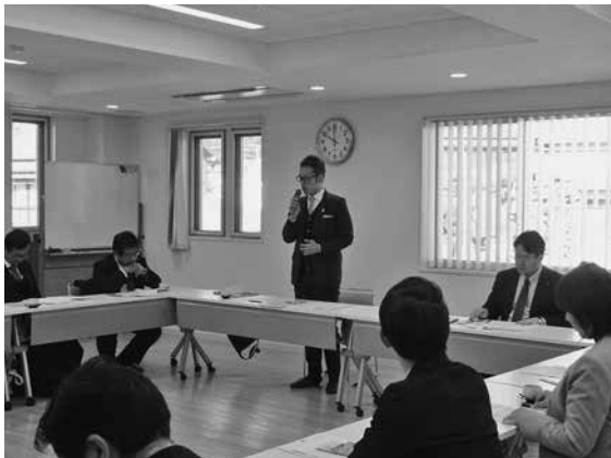
あいさつをする牛木委員長