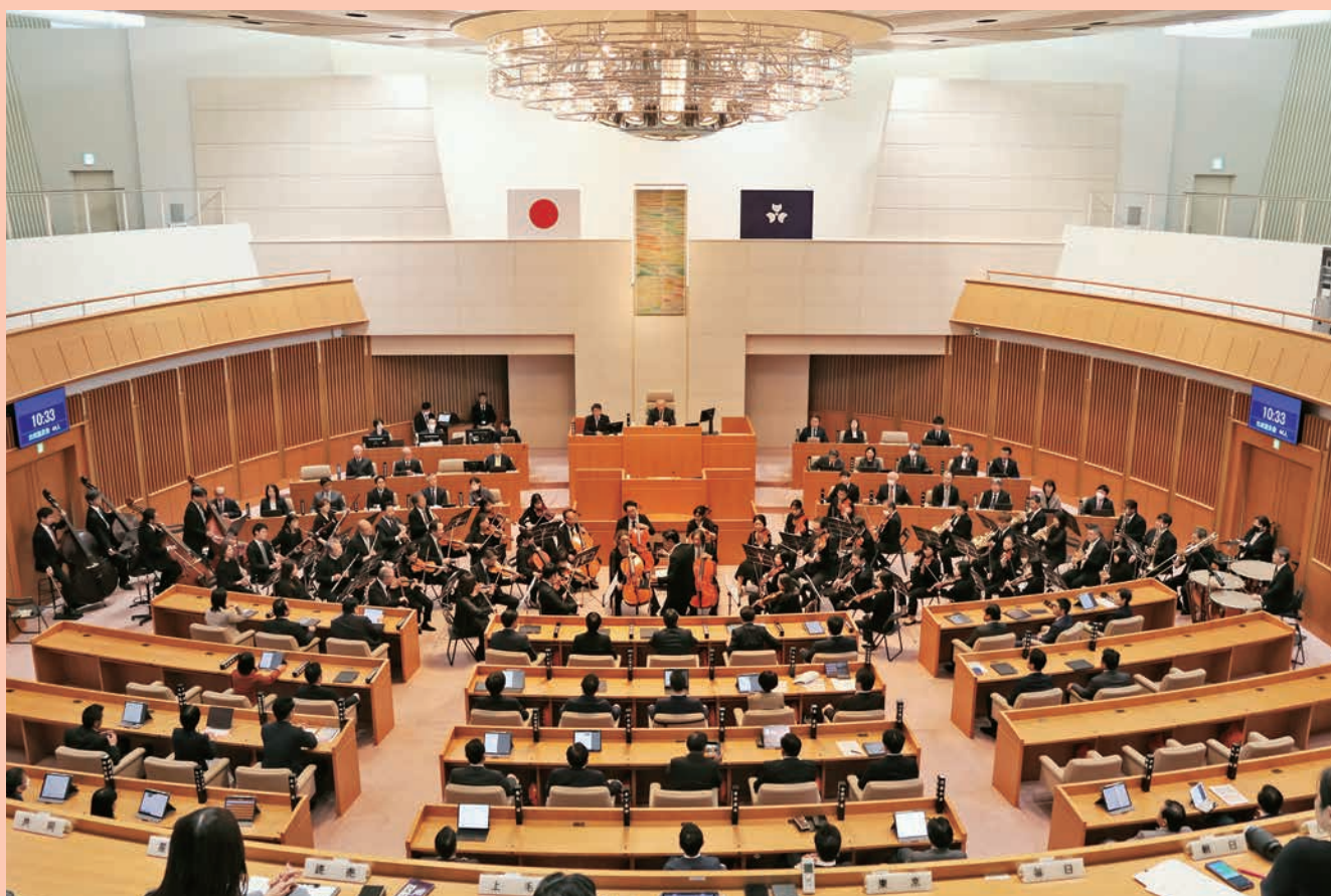
群馬交響楽団による議場演奏