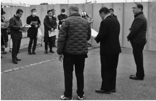
クラブハウス工場の説明を受ける様子