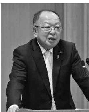
自由民主党 狩野 浩志 議員（前橋市）