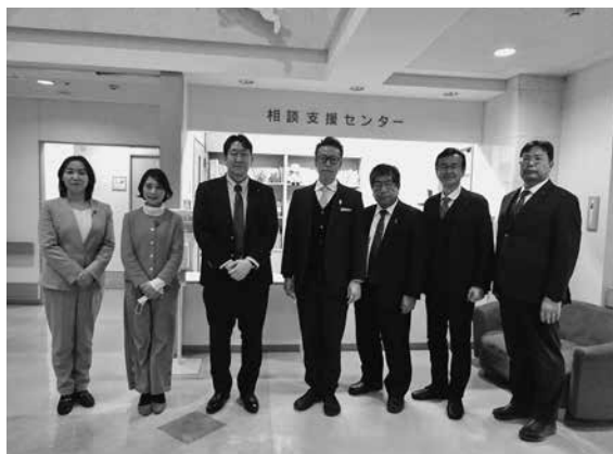
社会福祉法人 希望の家

とから、試行錯誤や苦勞の状況も伺えたが、同センターが一層認知され、必要な支援が継続して行われていくことを期待し調査報告と致します。