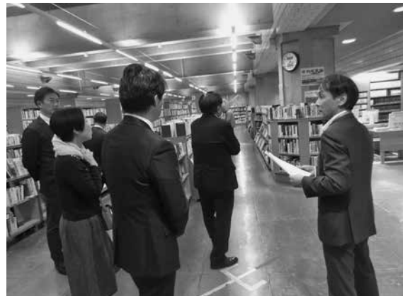
館内の施設設備について説明を受ける