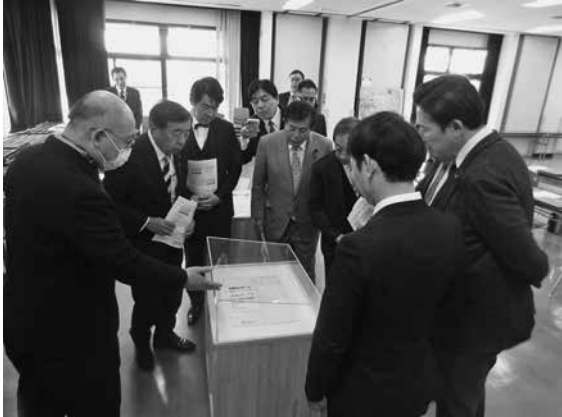
展示資料の説明を受ける