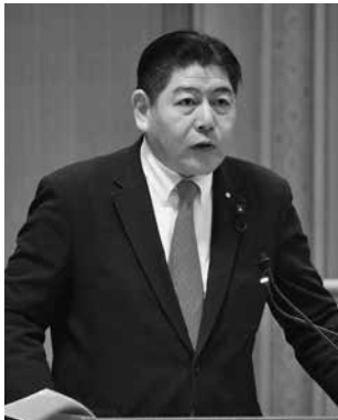
群馬維新の会 宮崎 岳志 議員（前橋市）