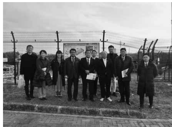
板倉ニュータウン・グリーンブロック

先進的な取組であるため、その利点をわかりやすく実感してもらうにはどうしたらいいか、工夫していく必要があると感じました。