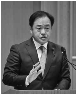
自由民主党 水野 喜徳 議員（吾妻郡）