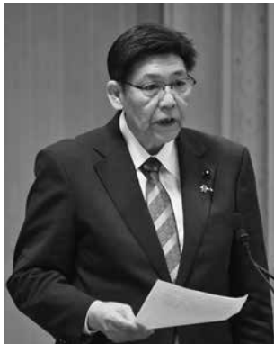
自由民主党 森 昌彦 議員（邑楽郡）