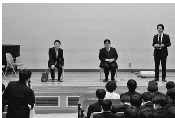
高崎高等学校での意見交換の様子