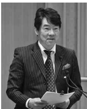
自由民主党 入内島道隆 議員（吾妻郡）