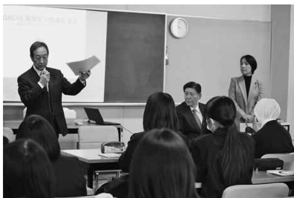
新田暁高等学校で生徒からの質問に答える議員