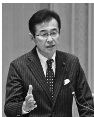
自由民主党 大和 勲 議員（伊勢崎市）