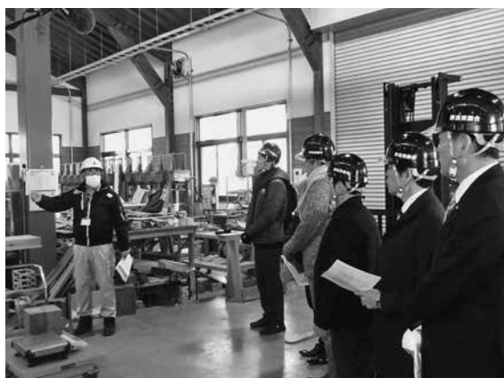
施設内の説明を受ける様子