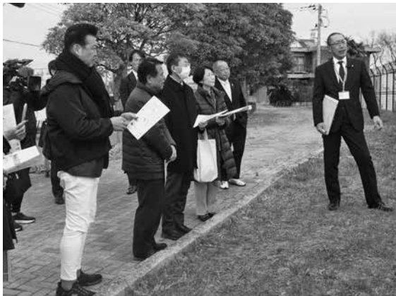
説明を受ける様子