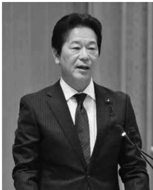
自由民主党 矢野 英司 議員（富岡市）