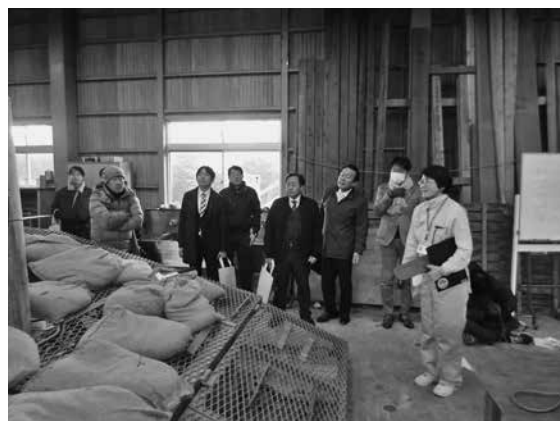
大学校内の説明を受ける様子