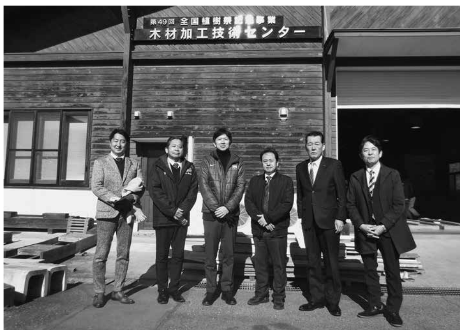
群馬県林業試験場