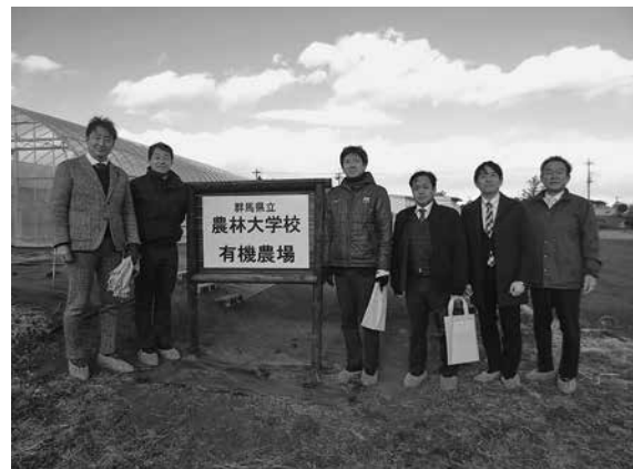
群馬県立農林大学校

従事者不足が叫ばれる農林業の振興に向け、同大学への期待はますます高まるものであり、大変有意義な調査であった。