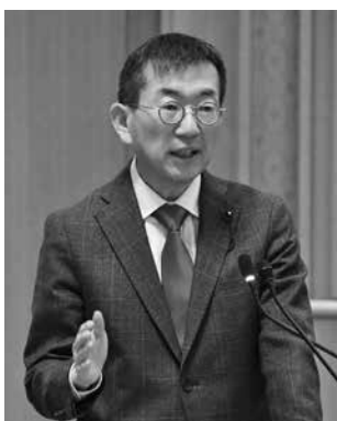
日本共産党 酒井 宏明 議員（前橋市）