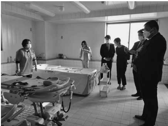
施設の説明を受ける様子