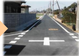
集落道路整備(農村集落の生活用道路の改良)