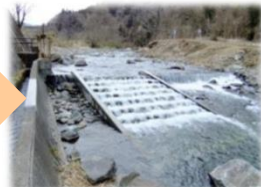
生態系保全整備(魚道の改修)