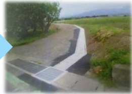
用排水施設整備(排水路の整備)