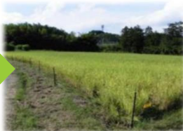
鳥獣被害防止施設整備(電気柵等の整備)