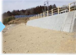
農地防災整備(ため池の護岸整備)