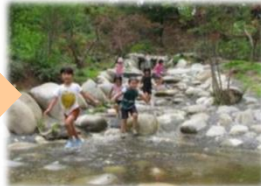
地域用水整備(親水施設の整備)