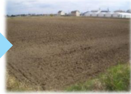
区画整理(水田の区画整理)