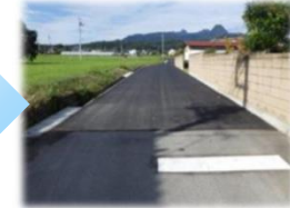
農作業道整備(農作業道の改良)