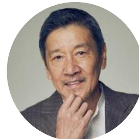
審査委員長 奥田 瑛二