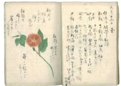
正岡子規「仰臥漫録」(虚子記念文学館蔵)