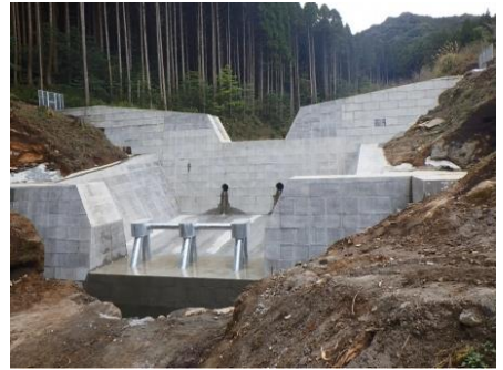
事業後のイメージ (一例)

◆ 砂防堰堤の整備により、大雨などによる土石流や流木の被害のリスクを軽減します。