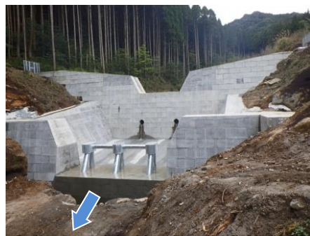
事業後のイメージ (一例)

◆ 砂防堰堤の整備により、大雨などによる土石流や流木の被害のリスクを軽減します。