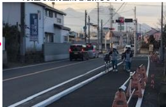
事業後のイメージ (一例)