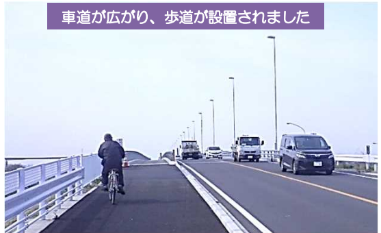
車道が広がり、歩道が設置されました