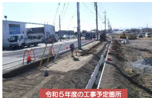
令和5年度の工事予定箇所