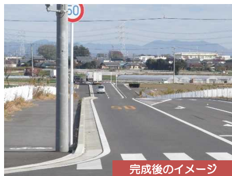
完成後のイメージ