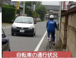
自転車の通行状況

◆周辺道路へ回り込む車両が多いが、道路幅が狭く、歩道も未整備のため、通学児童・生徒が危険にさらされています。