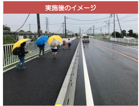
実施後のイメージ