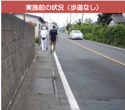
実施前の状況（歩道なし）