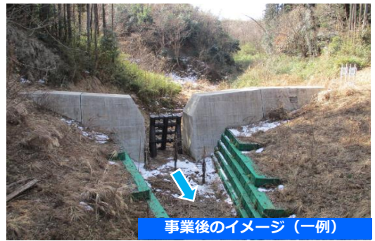
事業後のイメージ（一例）