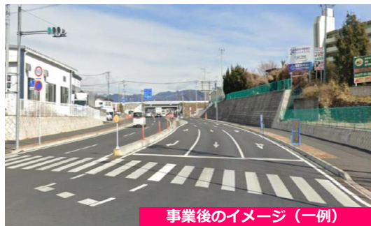
事業後のイメージ (一例)