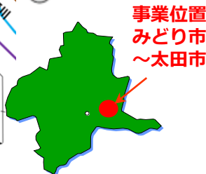
事業位置 みどり市 ～太田市