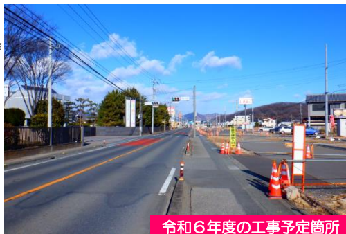
令和6年度の工事予定箇所