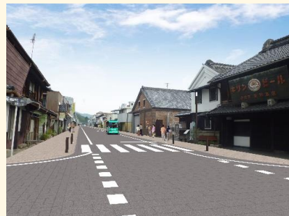
事業後のイメージ (一例)

◆電線を地中化し、電柱を撤去することで伝統的建造物が並んだまち並みと調和した景観を創り出します。