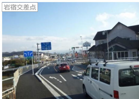
事業後の状況(一部完了区間)