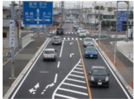
事業後のイメージ（一例）