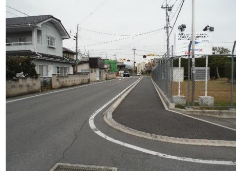
事業後のイメージ（一例）