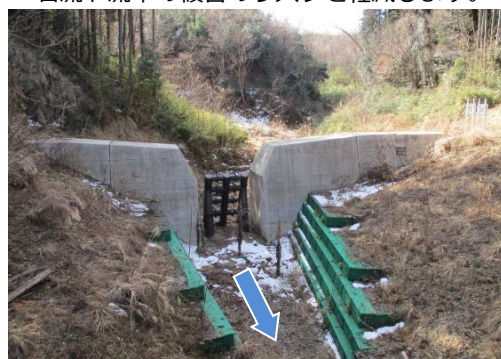
事業後のイメージ（一例）

◆ 砂防堰堤の整備により、大雨などによる土石流や流木の被害のリスクを軽減します。