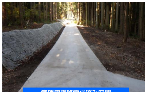
管理用道路完成済み区間