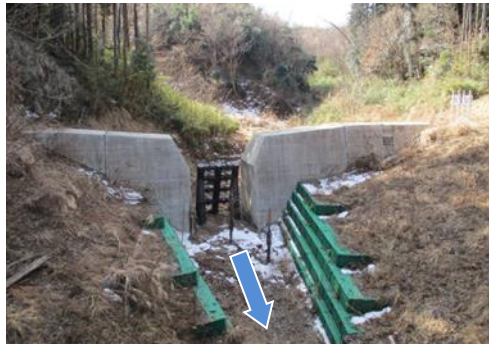
事業後のイメージ (一例)

◆ 砂防堰堤の整備により、大雨などによる土石流や流木の被害のリスクを軽減します。