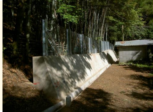
事業後のイメージ