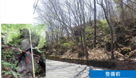
斜面上の転石、浮石

◆道路脇の法面は浸食が進み、大雨等の際に落石や土砂崩落により道路が寸断するおそれがありました。