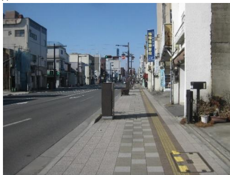
事業後のイメージ（一例）