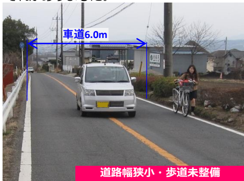
道路幅狭小・歩道未整備 事業前の状況