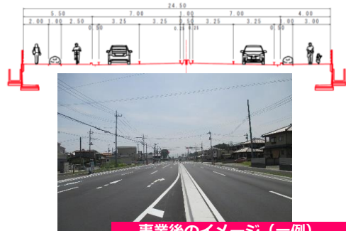
事業後のイメージ (一例)