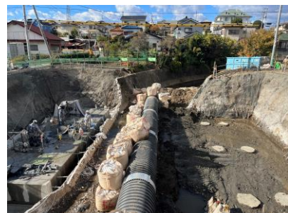
粕川橋 架け替え工事