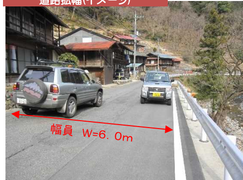
道路拡幅(イメージ)