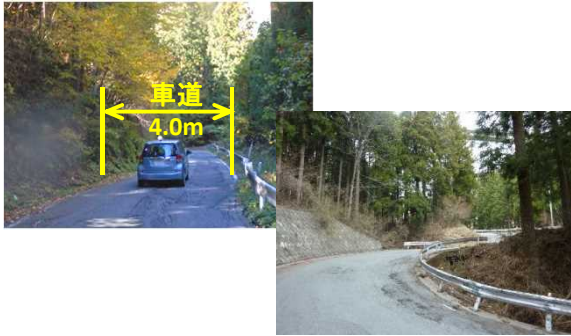
道路幅狭小・線形不良