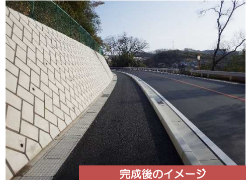
完成後のイメージ