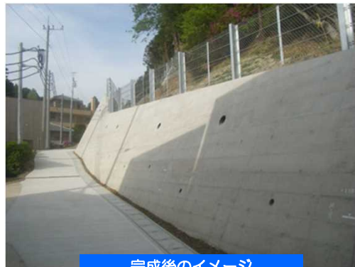
完成後のイメージ