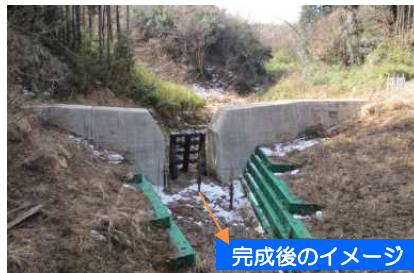
完成後のイメージ