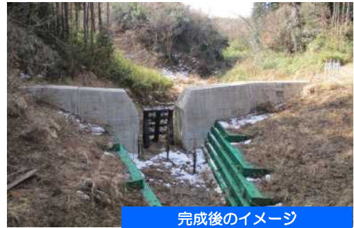
完成後のイメージ