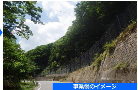
事業後のイメージ

◆ 法面の落石対策を行うことで、落石や土砂崩落による道路の寸断を防止し、孤立集落が発生するリスクを軽減します。