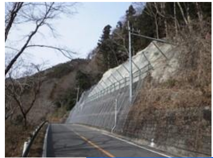
事業後のイメージ

◆ 法面の落石対策を行うことで、落石や土砂崩落による道路の寸断を防止し、孤立集落が発生するリスクを軽減します。