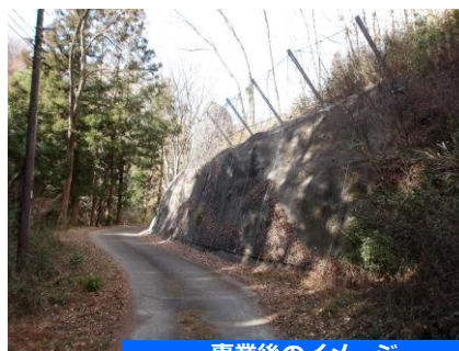
事業後のイメージ