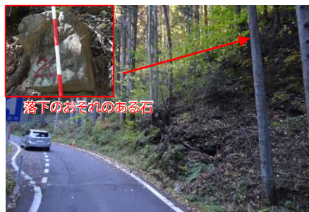
落下のおそれのある石