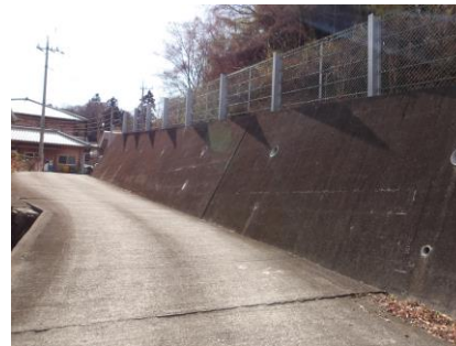
事業後のイメージ