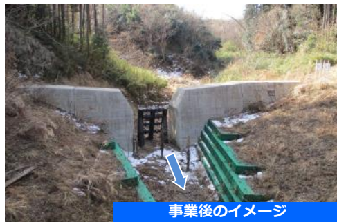
事業後のイメージ