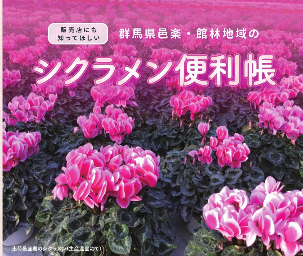
出荷最盛期のシクラメン(生産温室にて)